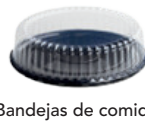
Bandejas de comida