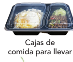
Cajas de comida para llevar