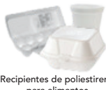
Recipientes de poliestireno para alimentos

Estos artículos NO SON RECICLABLES. Deposítelos en la basura: