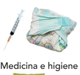
Medicina e higiene